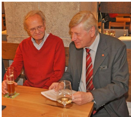
Weihnachtsstammtisch 2012 Bräustüberl Freistadt

Schade, dass es ihm in letzter Zeit nicht mehr möglich war zu seinem Stammtisch zu kommen. Er selbst, aber auch natürlich wir, haben das sehr bedauert.